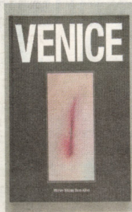
עטיפת הספר.

"אמננו חיים בתקופה שבה מגיבים מהר לכל דבר, אולי קצת מתוך תקווה להניח פלטטר על הפצע שלנו – וזה בסדר. אני בעד כל מה שעושה טוב ומייטיע להת' מודה. מצד שני, אמנות היא לא כדור נגד כאבים, ואני לא כמטחה מקביל להתיבה קיבלה ממד יותר פיזי, היום אני מרגישה צורך שאני מביאה את הגוף גם לכתי' לה וגם לרישום וגם לציור, וזה לא מוביל או סוגר אותי." המחשבה הוה נקשרת באותו צורך חושבת שו' לא המטרה של אמ' נות. את לא צריכה לעבור דווקא מדבר. אבל אם את יכולה חלקא להתעכב על הפצע וליצור מתוכו משוה חדש בעולם, או הפצע מק' בל פתאום איכות אחרת, שיש בה גם יופי והמלה."